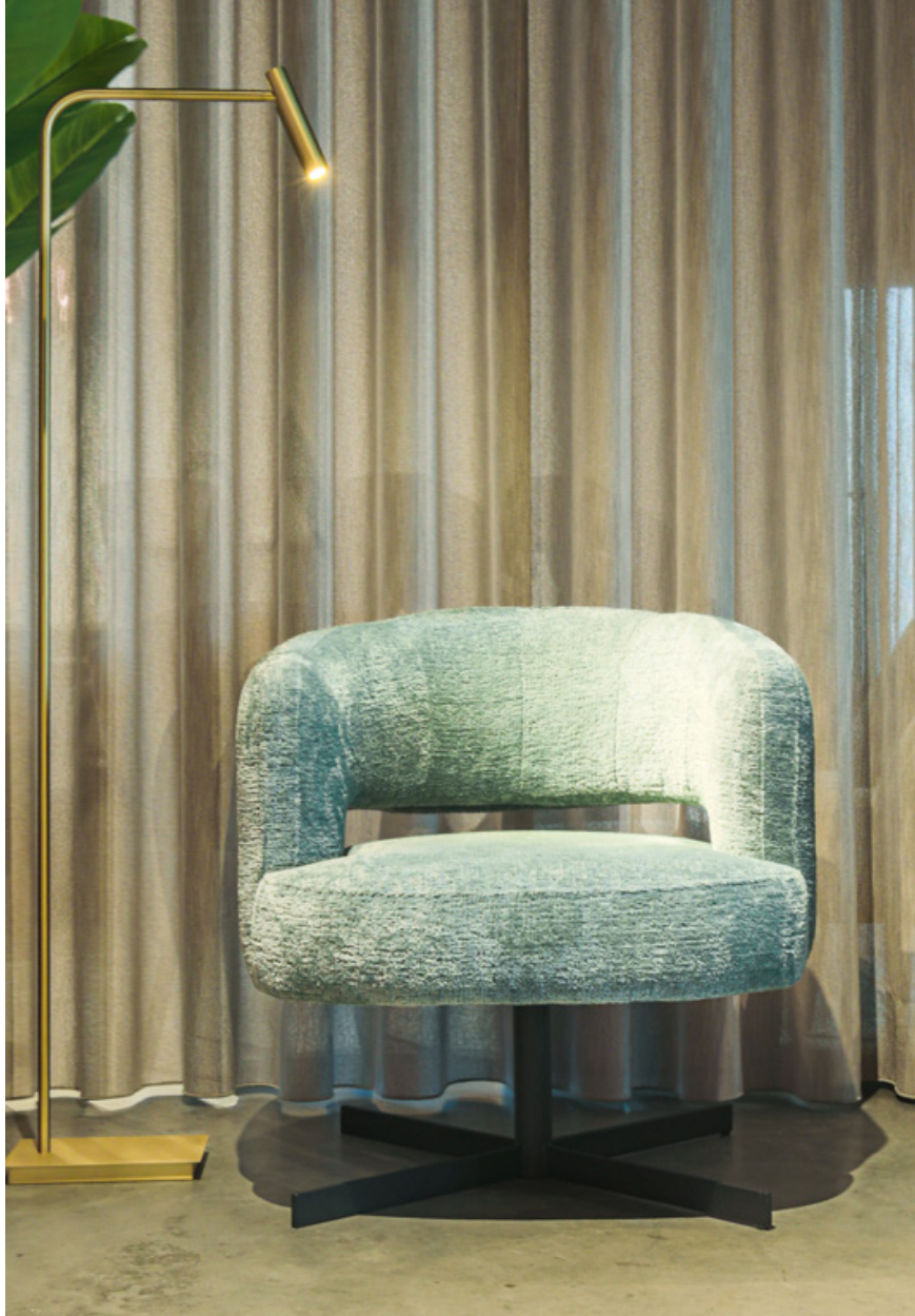
1-seat 75W x 75H x 70D

VIGO designed and developed in Belgium | since 1978 www.ledacollection.be